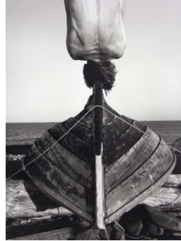
Arno Rafael Minkinen